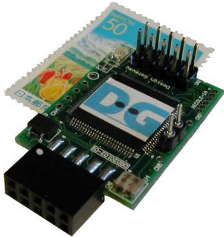
[图 3] FlashLink AX Type-A (試作向け) 写真