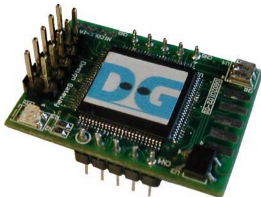
[图 4] FlashLink AX Type-B (量産向け) 写真